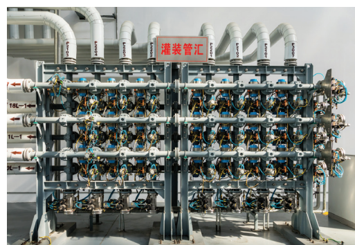
Готовый манифольд, оснащенный 8 входами и 6 выходами.