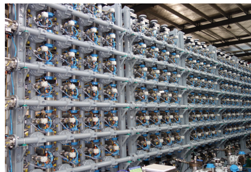
3-дюймовый коллектор с 36 входами и 12 выходами.

Промышленная группа «Метран» Россия, г. Челябинск Приемная, служба маркетинга: Телефон: +7 (351) 799-51-52 e-mail: Info.Metran@Emerson.com