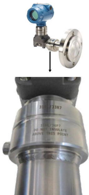
Рисунок 2. Особенности теплоизоляции систем с двойной разделительной мембраной

Система с установленной двойной разделительной мембраной использует повышенную температуру технологического процесса для поддержания работоспособности обеих жидкостей в системе, в этом случае не всегда требуется теплоизоляция. Однако, исходя из общей практики, рекомендуется теплоизолировать подобные системы для того, чтобы обеспечить им оптимальные условия работы. Рекомендуем не устанавливать разделительную двойную мембрану выше линии, отмеченной на самой мембране, — для справки см. рисунок, приведенный ниже.