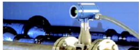
설치된 로즈마운트 8800 Vortex 유량계

이 고객은 이후 또 다른 제조업체의 Vortex 유량계로 교체하였지만 새롭게 설치된 유량계도 여전히 2주마다 꺼내어 청소해야 했다. 21개 유량계 각각은 청소하는데 1시간 반이 소요되었고 이 때문에 생산시간이 하루 이상 줄어들었다. 월별 총 유지보수 시간은 유량계를 제거해서 청소하고 재설치하는데 63만아워가 소요되었다.