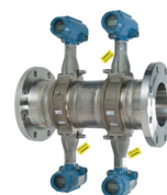
Rosemount 8880 Quad Misuratore di portata Vortex

Ecco alcuni dei prodotti Emerson con certificazione di sicurezza IEC 61508