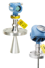
Rosemount 5408 e 5300 Radar non contatto e radar ad onda guidata