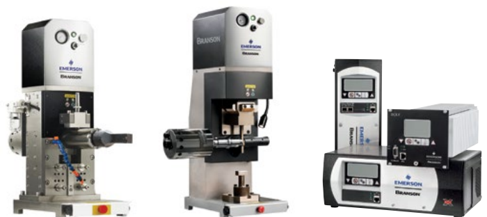
Gamme complète des équipements Branson de soudage des métaux par ultrasons

BRANSON ™ Pour plus d'informations, rendez-vous sur Emerson.com/Branson