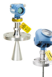
Rosemount 5408 y 5300 Radar sin contacto y radar de onda guiada